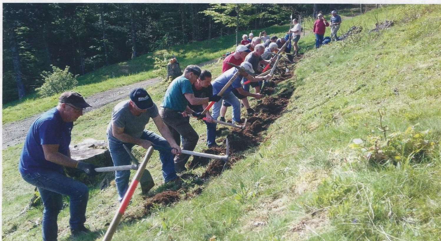
Journée de travail en commun : CV Saint-Amarin et Masevaux au printemps 2019 au Gazon Vert. C'est une belle démonstration de l'investissement des bénévoles pour la création et l'entretien des sentiers de randonnée